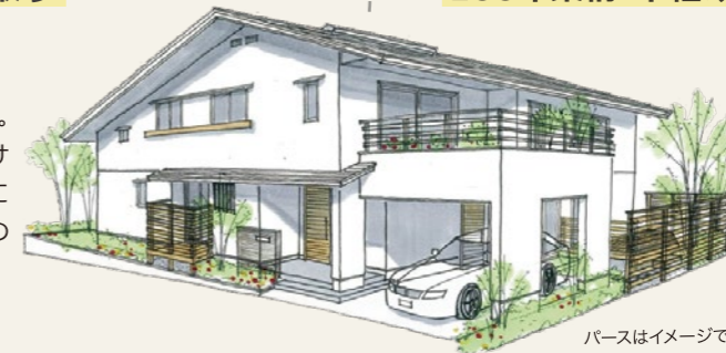
パースはイメージです

妻が小山展示場に一目惚れ。坪数を抑えながら、できるだけ内装や仕上がりを展示場仕様に近づけました。夫婦それぞれの夢を叶えた家です。