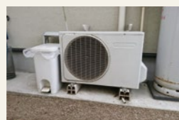
当社展示場の場合