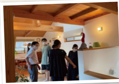
築18年目の入居者宅見学の様子

今回は完成住宅と築18年目の入居者宅を併せてご見学いただくという、新しい試みでしたが、新築の家はもちろん、年数を経たからの家はむしろ味わいが増し、「ついつい長居してしまいました」と仰る方が多く、皆さまに好評だったと感じています。