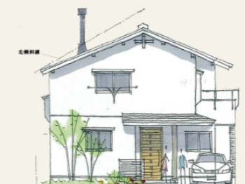
パースはイメージです

実は以前、10年以上四季工房の家に住んでいました。仕事の都合でアパートに住むことに…。空気の悪さ、ジメジメ感にすっかり嫌気が差し、思い切って土地を求め再び家づくりをしています。